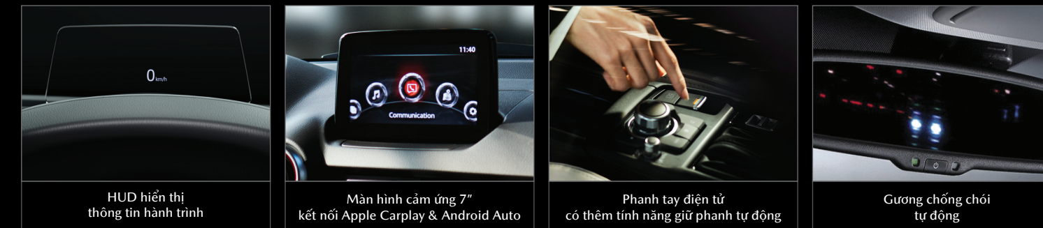
HUD hiển thị thông tin hành trình

Mazda CX-3 trang bị tiện nghi cao cấp, đáp ứng các nhu cầu ngày càng cao và mang lại sự hài lòng nơi khách hàng