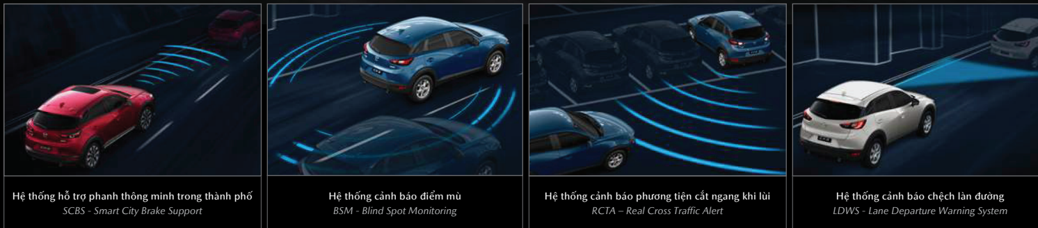
Hệ thống hỗ trợ phanh thông minh trong thành phố SCBS - Smart City Brake Support

Mazda CX-3 là mẫu xe SUV đô thị được trang bị đầy đủ các tính năng an toàn chủ động thông minh.